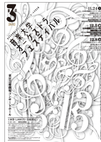
このフェスティバルは各大学間の交流を目的としています。その一環として、各大学の演奏の前には共演校からのエールを込めたファンファーレの演奏があります。

主催:音楽大学オーケストラ・フェスティバル実行委員会/ミュゼザ川崎シンフォニーホール(川崎市文化財団グループ)/東京芸術劇場(公益財団法人東京都歴史文化財団)